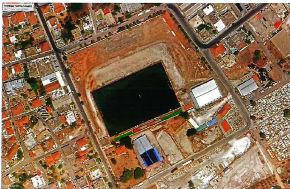
Θέση υλοποίησης έργου: Γήπεδο Γαργαλιάνων, Δήμου Τριφυλίας

Η προμήθεια θα υλοποιηθεί υπό την εποπτεία της Δ/νσης Τεχνικών Έργων ΠΕ Μεσσηνίας και κατόπιν υπογραφής Προγραμματικής Σύμβασης, μεταξύ Περιφέρειας Πελοποννήσου και Δήμου Τριφυλίας.